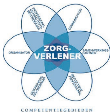
Figuur 1. CanMEDS

In dit Expertisegebied wordt bij elke CanMEDS-rol een korte, algemene beschouwing op de rol van de verpleegkundige binnen het Expertisegebied urologieverpleegkundige beschreven. Vervolgens worden per rol in grote lijnen de generalistische kennis en vaardigheden uit het (basis)Beroepsprofiel beschreven. Vervolgens worden per rol de aanvullende, specifieke kennis en vaardigheden beschreven die een helder beeld geven van hetgeen de urologieverpleegkundige uniek maakt ten opzichte van verpleegkundigen in andere Expertisegebieden.